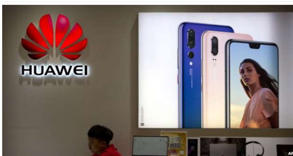
Điện thoại Huawei.

Tuy vậy, Bộ Quốc phòng Mỹ đã ra lệnh dừng cung cấp thiết bị Huawei tại các căn cứ quân sự Mỹ với lý do an ninh. Best Buy, một trong những nhà bán lẻ hàng điện tử lớn nhất ở Mỹ, cũng đã dừng bán sản phẩm Huawei.