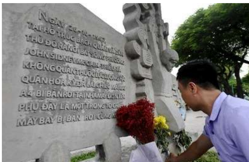
Một người Việt đặt hoa tưởng nhớ TNS John McCain ở Hồ Trúc Bạch nơi máy bay của TNS John McCain bị bắn rơi ở Hà Nội năm 1967

Không phải tự nhiên mà truyền thông Mỹ và mạng xã hội hôm nay tràn ngập những lời tốt đẹp khi nói về ông. Một người chỉ có thể trở thành anh hùng của dân khi không chỉ có lòng quả cảm mà còn phải có đủ tài năng và đạo đức, đạo đức của một con người”.