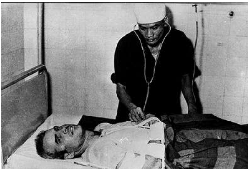
Hình chụp hôm 27/10/1967: Một bác sĩ Việt Nam khám bệnh cho Thiếu tá Hải quân Hoa Kỳ John McCain

Báo Lao Động với tiêu đề “Thượng nghị sĩ John McCain và định mệnh mang tên Việt Nam” cho rằng, ông là một trong những người có đóng góp tích cực nhất vào quá trình bình thường hóa và phát triển quan hệ Việt - Mỹ.