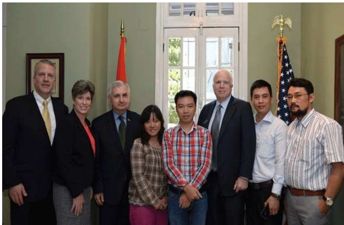
Cuộc gặp của TNS với các nhà hoạt động xã hội và nhân quyền ở Hà Nội năm 2015