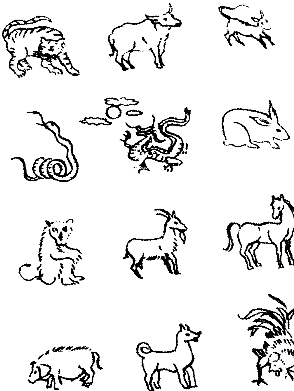
Hình trên: Mười Hai Con Vật Địa Chi