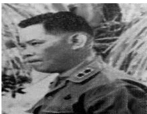
Thiếu Tướng Nguyễn Khoa Nam

Nguồn: http://chouxuannguyen.org/2013/04/06/thieu-tuong-nguyen-khoa-nam-nguoi-hung-cua-vung-iv-chien-thuat/