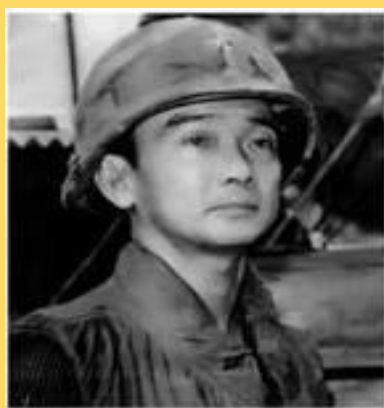
Lê Văn Hưng (1933-1975) Chuẩn Tướng Tư Lệnh Phó Quân Đoàn IV 30/4/1975