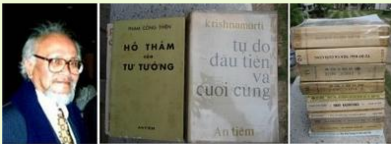
PHẠM CÔNG THIỆU và những tác phẩm để đời