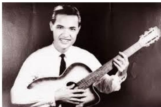
Nhạc sĩ Thanh Sơn

Cố nhạc sĩ Thanh Sơn được người mến mộ biết đến là một nhạc sĩ nổi tiếng với những ca khúc viết về tình cảm tuổi học trò, đặc biệt là viết về mùa hè với những nhạc khúc như: Nỗi buồn hoa phượng , Hạ buồn , Phượng buồn , Ba tháng tạ từ , Lưu bút ngày xanh ,... hay những nhạc phẩm thuộc chủ đề khác cũng nổi tiếng không kém như: Nhật ký đời tôi , Màu hoa anh đào , Hành trình trên đất phù sa , Hình bóng quê nhà ... Những sáng tác của ông đã trở thành bất hủ và vẫn được mọi người yêu thích cho đến ngày nay.