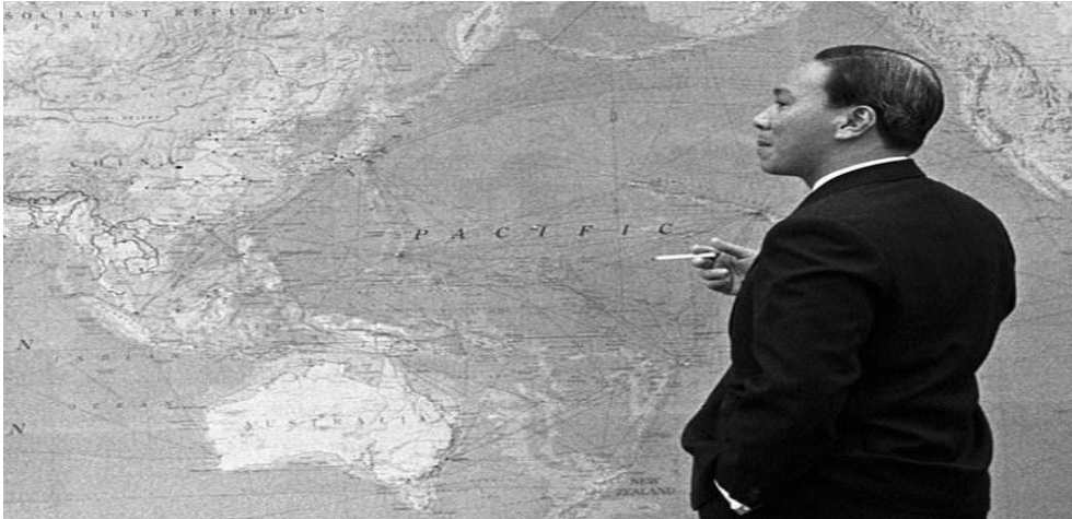
Tổng thống Nguyễn Văn Thiệu