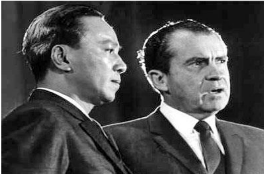
Tổng thống Nguyễn Văn Thiệu và tổng thống Nixon năm 1973