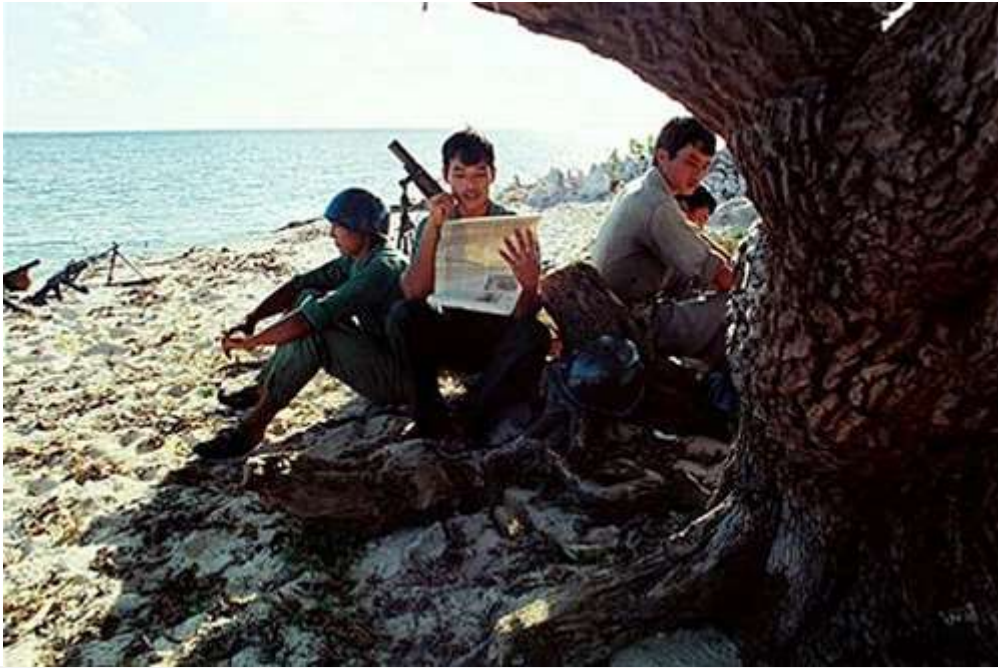
Phút bình yên.