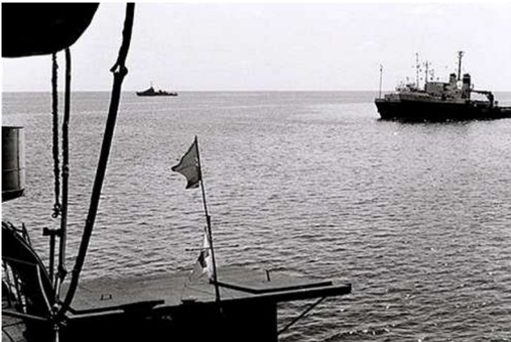
Phía xa, trên góc trái ảnh là tàu chiến Trung Quốc luôn lượn lờ rình rập.