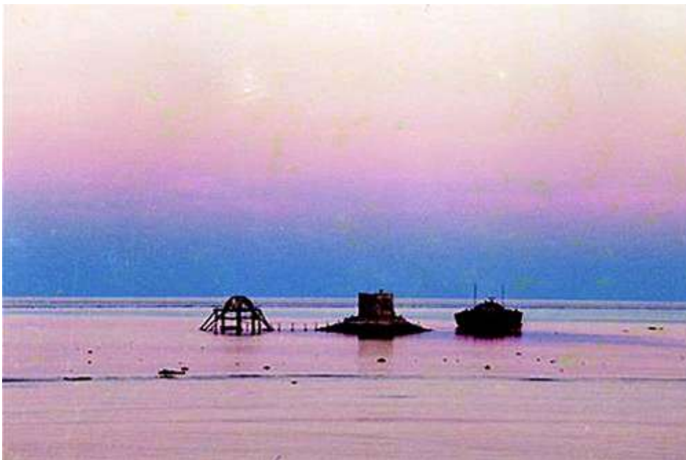
25 năm trước, hoàng hôn trên đảo Phan Vinh.