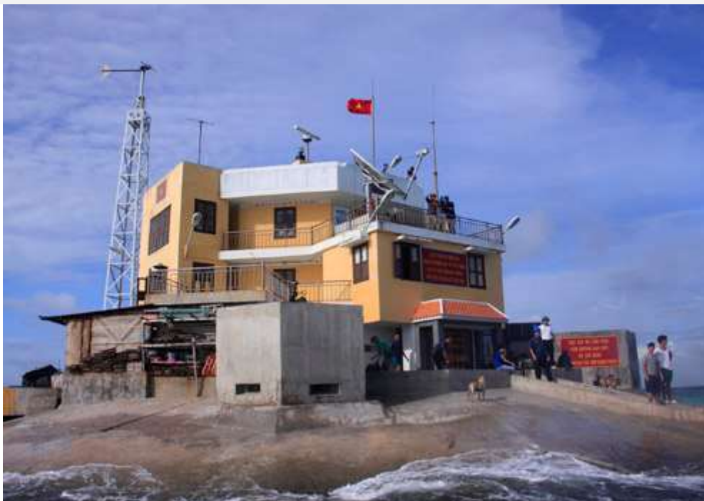
...Đảo chìm Len Đảo được xây dựng kiên cố.