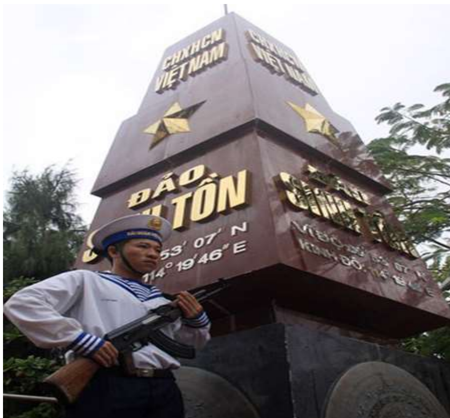
Việt Nam đã đóng quân tại đảo Sinh Tồn từ năm 1974 và nơi đây chỉ cách đảo Gạc Ma bị Trung Quốc chiếm đóng chừng vài hải lý.