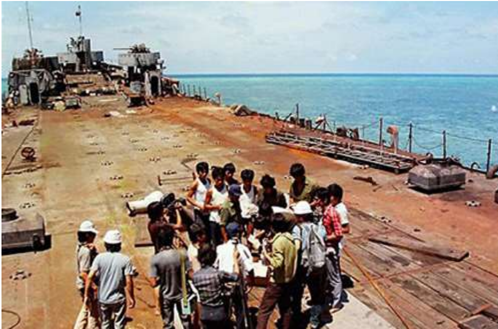
Phỏng vấn các chiến sĩ trên tàu 505, con tàu mặc dù đã bị quân Trung Quốc xâm lược bắn cháy vẫn lao lên đảo Cô Lin giữ đảo, khẳng định chủ quyền của Việt Nam.