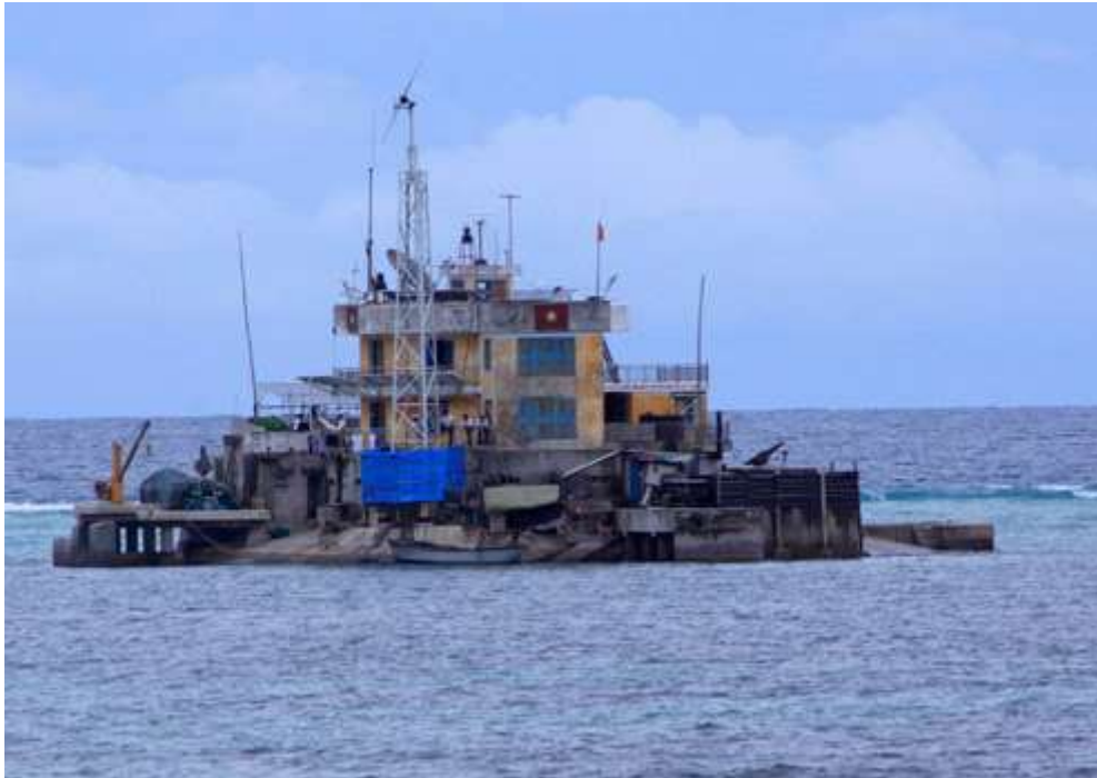
Đảo chìm Cô Lin...