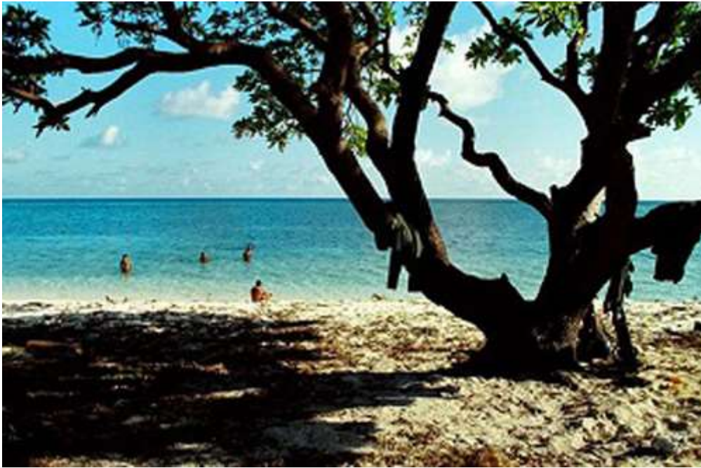
Cây phong ba trên đảo