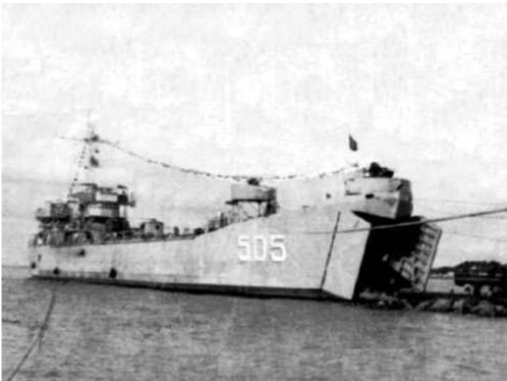
Tàu HQ505 đã lao lên bãi ngầm ở đảo Cô Lin cắm cờ khẳng định chủ quyền Tổ quốc vào ngày 14/3/1988.