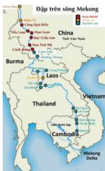
Các đập thủy điện trên sông Mekong - hình internet

Từ trước đến nay, Trung Quốc luôn giữ kín thông tin về việc vận hành 11 con đập thủy điện. “Tuy nhiên, với dữ liệu hình ảnh vệ tinh rõ ràng, chúng ta có thể chứng minh kỹ nguyên che đậy thông tin đã chấm dứt”, chuyên gia Eyler nhấn mạnh.