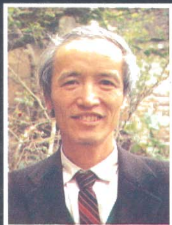
PGS-PTSCHUQUANGTRÚ HÀ BẮC - 1941