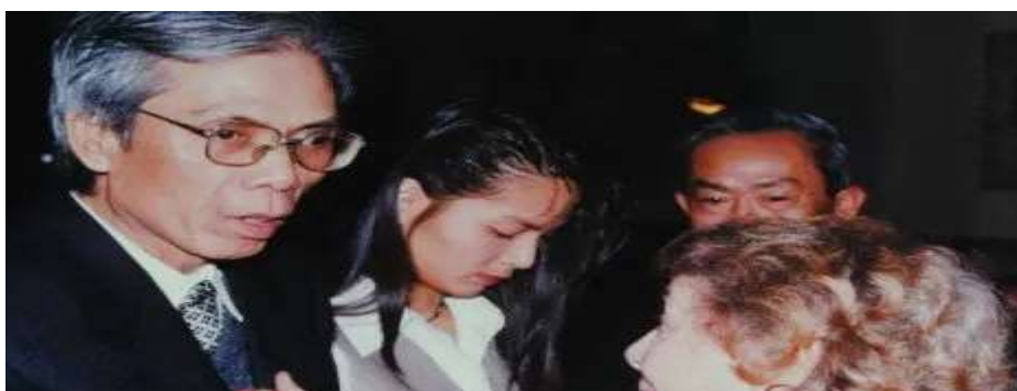
Chụp lại hình ảnh, Ngục sĩ Nguyễn Chí Thiện