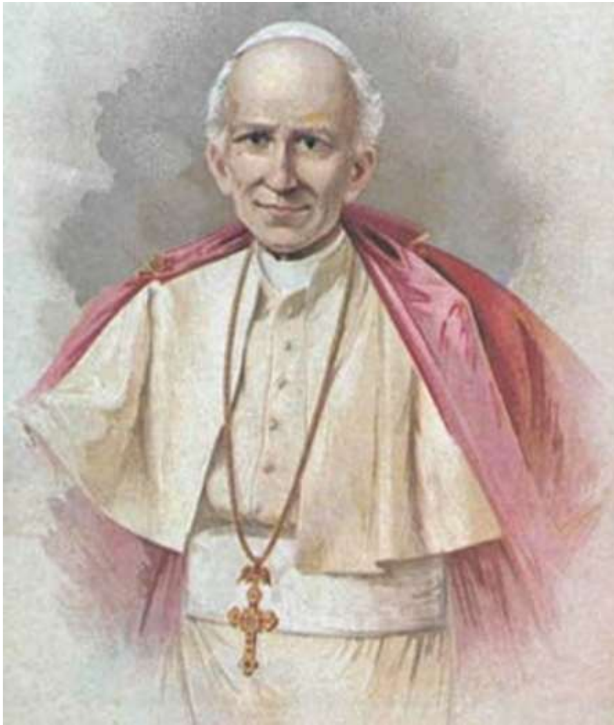
Đức Thánh cha Lêô XIII