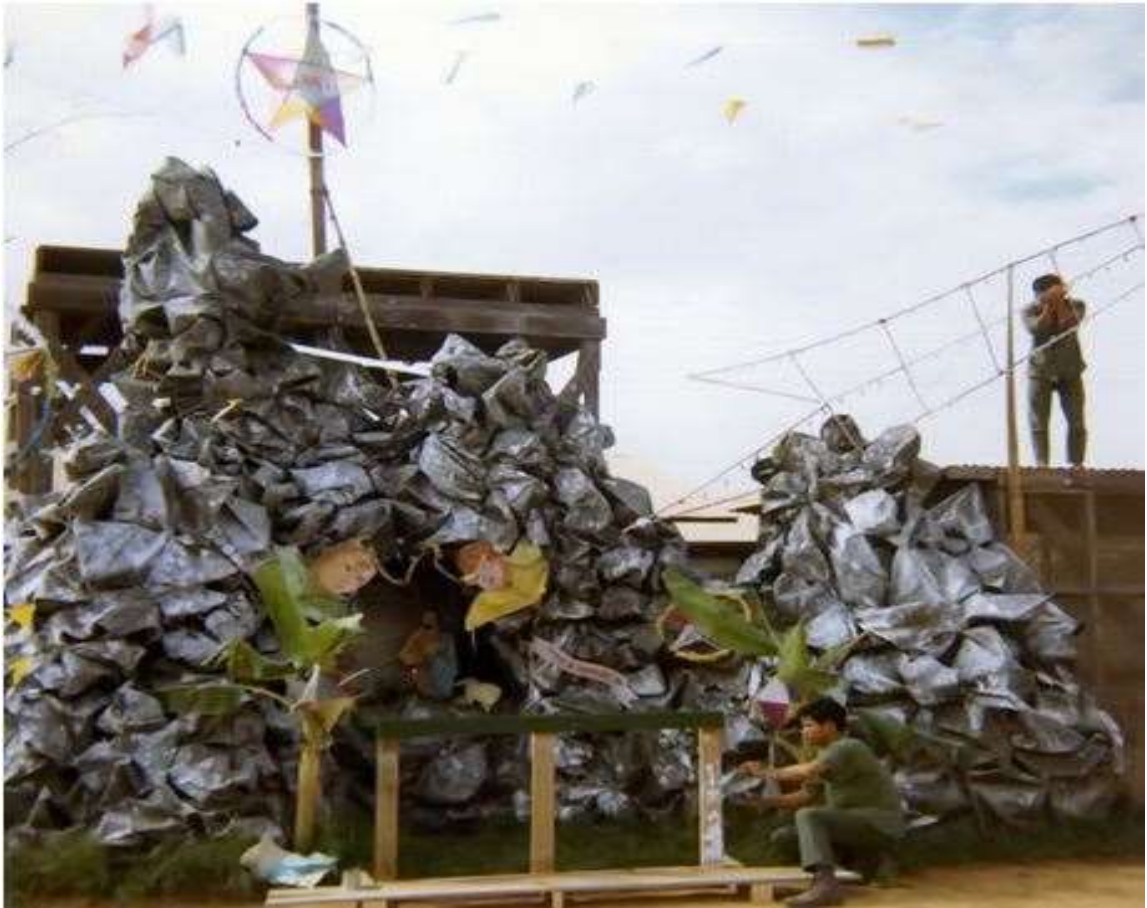
Các quân nhân Sư Đoàn 7 BB đang trang trí hàng đá trong đơn vị