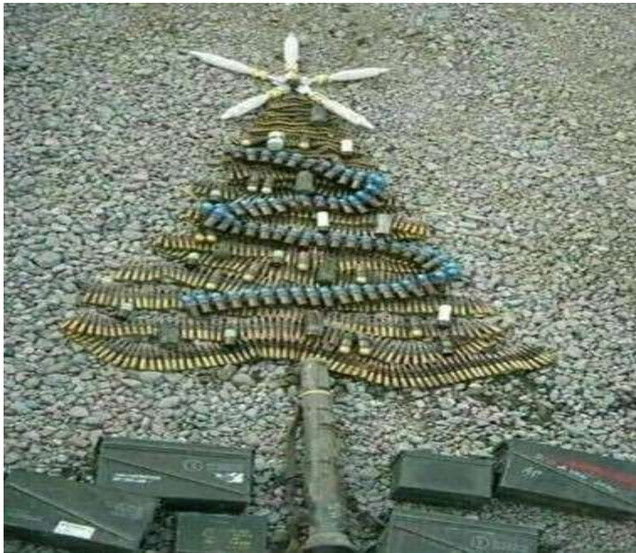
Còn đây, là những hình ảnh của Người Lính Việt Nam Cộng Hòa đã đón Giáng Sinh ở những doanh trại, tiền đồn, hay các Căn Cứ xa xôi: