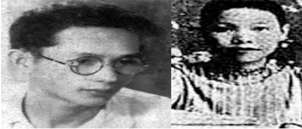
Chuyện tình Mạc Tử – Mộng Cẩm