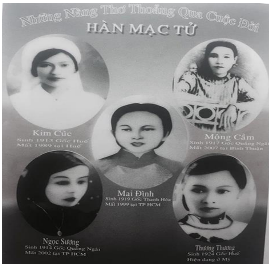
Các bóng hồng đi qua cuộc đời Hàn Mặc Tử

Ngay từ cái nhìn đầu tiên, Hàn Mặc Tử đã đem lòng yêu say cô gái có tâm hồn văn chương giống mình.