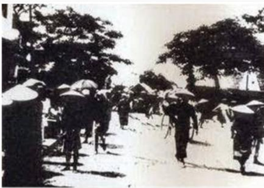
Cuộc nổi dậy ở Quỳnh Lưu 13-11-1956-(Nghệ An) Sau cái gọi là Nghị quyết sửa sai của đảng CSVN về những đợt CCRĐ dẫm dẫm máu.

Dân chúng đã dùng ngay chính sách sửa sai của CSVN để đòi lại chồng con đã bị giết, tài sản đã bị cưỡng đoạt và đòi được di chuyển tự do vào Nam như đã cam kết trong Hiệp định Geneva. Giữa lúc đó, được tin chiều ngày 9/11/1956, Ủy Ban Kiểm Soát Đình Chiến sẽ đi qua Cầu Giát để lên Hà Nội, hàng ngàn người đã kéo ra đường số 1 chờ đợi. Đồng bào đã góp đơn lại giao cho 6 thanh niên đại diện đưa thư. Mấy ngàn đồng bào đã nằm ngay trên đường để chặn xe lại. 6 thanh niên đã đưa cho viên sĩ quan Ấn Độ trong Ủy Ban mấy vụn lá thư đựng trong bao bố. Viên sĩ quan này cho biết sẽ trình lại cấp trên và trả lời vào ngày thứ Bảy trong