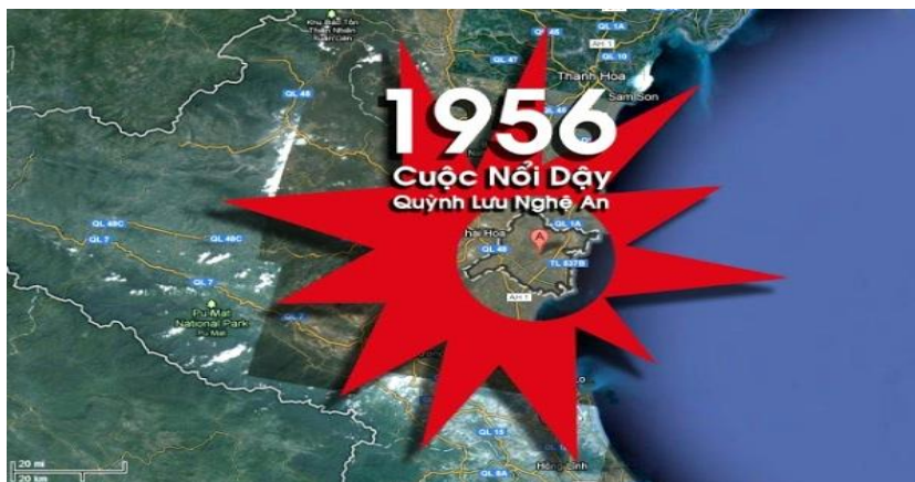
Tài liệu sưu tầm của JB Nguyễn Văn Định

Năm 1956, cuộc nổi dậy của đồng bào huyện Quỳnh Lưu, tỉnh Nghệ An, là 1 cuộc đấu tranh đẫm máu chống lại chính sách cai trị dã man của lãnh đạo CSVN, mà qua đó, chính sách Cải Cách Ruộng Đất đã là nguyên nhân chính làm bùng nổ cơn phẫn nộ của người dân. Cuộc nổi dậy Quỳnh Lưu bị đảng CSVN bưng bít tin tức rất kỹ vì tầm mức ảnh hưởng nguy hiểm của nó; trong khi cuộc đấu tranh của các văn nghệ sĩ trong biến cố Nhân Văn Giai Phẩm may mắn hơn, được loan tin vào miền Nam VN thời bấy giờ, với những tư liệu lịch sử rất giá trị. Nhưng không vì thế mà cuộc nổi dậy Quỳnh Lưu bị chôn vùi với nỗi oan khiên của những nạn nhân đã chết. 1 số nhân chứng hiếm hoi đã kể lại, viết lại để các thế hệ tiếp nối hiểu được những gì xảy ra dưới chế độ XHCN. Tội ác của lãnh đạo CSVN không thể đếm bằng số người dân đã chết. Mục đích của tội ác đã đi ra khỏi giới hạn suy nghĩ của loài người.