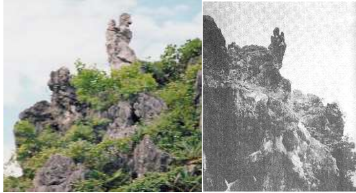
Núi Tô Thị ( Hòn Vọng Phu ) ở Động Tam Thanh- Tỉnh Lạng Sơn

( Nam Thiên : Kinh Việt, Hoa Tiên Rồng , trang 167 )