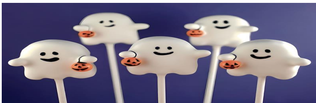
Kẹo hình ma Halloween

Bánh quy và kẹo là thức quà không thể thiếu trong lễ hội Halloween , đặc biệt là với trẻ em. Các loại bánh quy và kẹo sẽ được tạo hình và trang trí theo chủ đề Halloween.