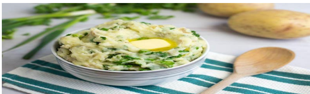
Món khoai tây nghiền Colcannon