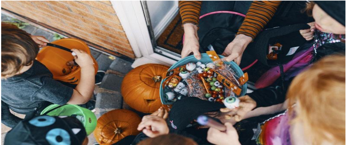
Trẻ em gõ cửa xin kẹo dịp Halloween

"Gõ cửa xin kẹo" là một hoạt động vui nhộn dành cho trẻ em dịp Halloween. Trước khi ra khỏi nhà, trẻ em thường được người lớn hỗ trợ hóa trang thành các nhân vật chúng yêu thích và có kèm theo túi hoặc thùng để đựng kẹo.