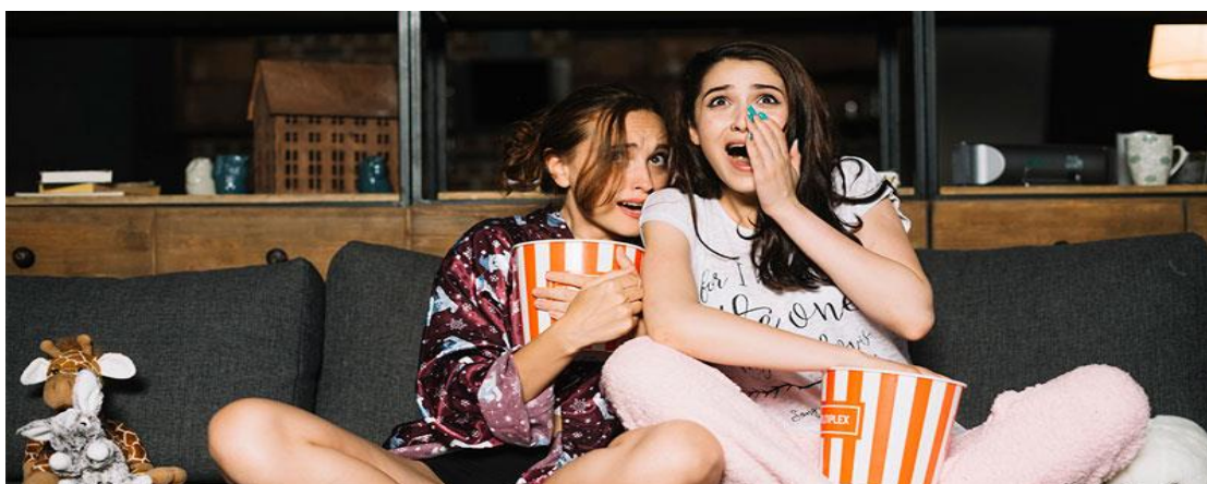
Xem phim kinh dị dịp Halloween

Xem phim kinh dị và thăm nhà ma là những hoạt động tìm kiếm cảm giác mạnh trong dịp Halloween. Trong khoảng thời gian này, các bộ phim kinh dị được nhiều người săn lùng để xem. Nhiều nơi tổ chức các trạm kinh dị hoặc nhà ma ám trong dịp Halloween. Đây là những địa điểm được bài trí với các phụ kiện, ánh sáng ma quỷ và có nhân viên hóa trang thành những nhân vật đáng sợ để hù dọa người tham gia. Người chơi sẽ phải vượt qua các thử thách và cảm giác sợ hãi, điều đó giúp họ tạo ra trải nghiệm đáng nhớ trong dịp lễ hội Halloween .