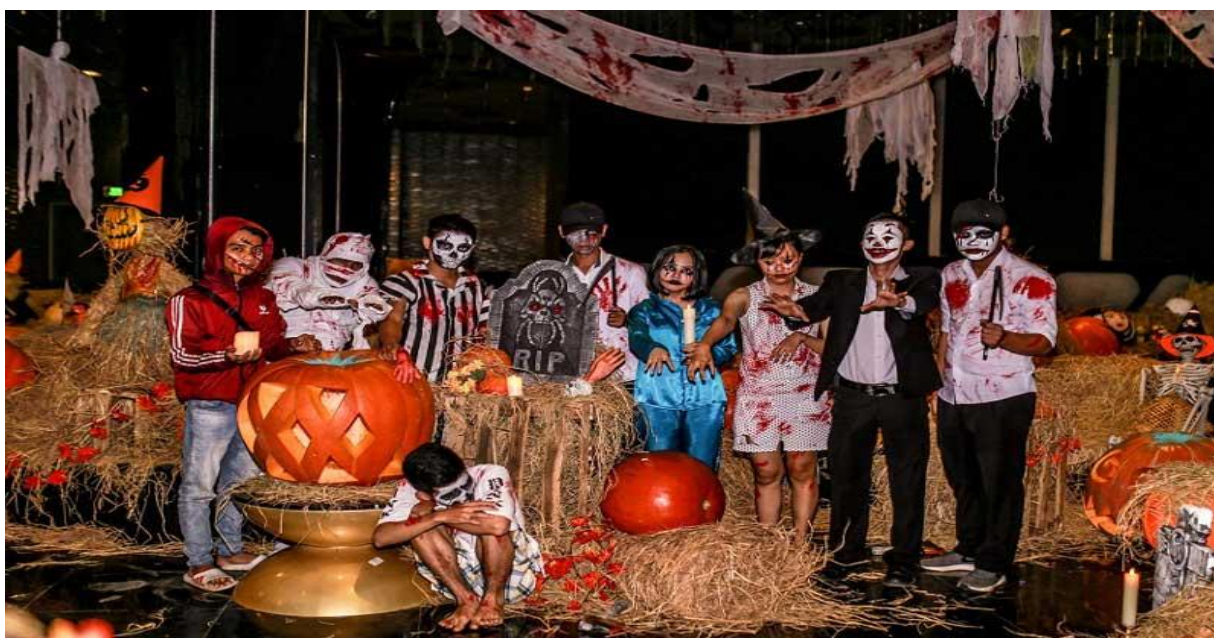
Hóa trang dịp Halloween

Hóa trang là một trong những hoạt động được đón chờ nhất trong ngày Halloween . Trong dịp này, mọi người sẽ biến hóa thành những nhân vật kỳ quái, ma quỷ hoặc bất cứ thứ gì mà họ mong muốn. Người ta sẽ sử dụng mỹ phẩm để trang điểm biến đổi khuôn mặt giống với nhân vật được hóa trang.