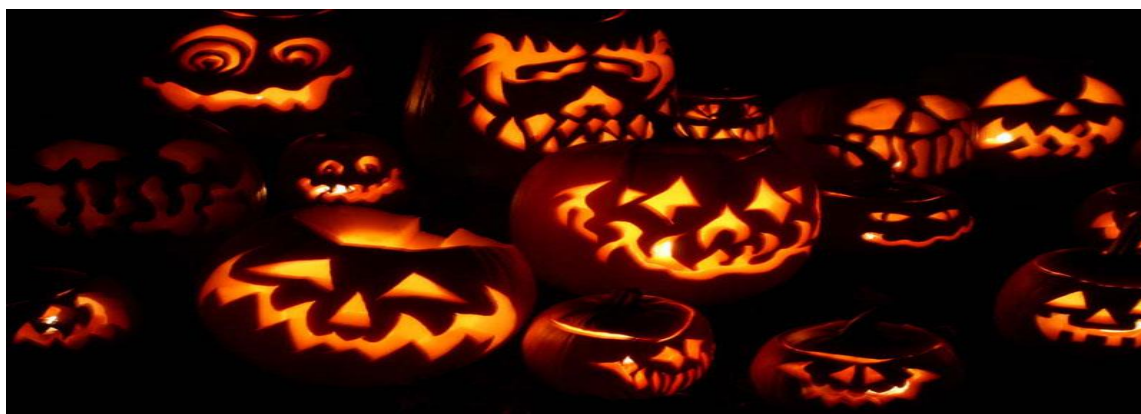
Điêu khắc bí ngô dịp Halloween