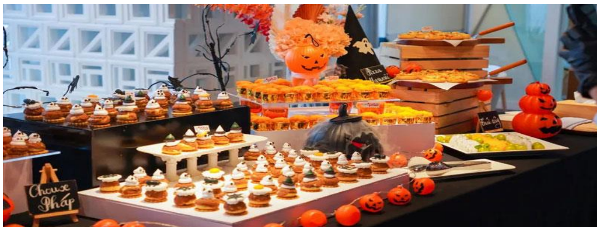
Tiệc mừng dịp Halloween

Tổ chức tiệc mừng là một phần quan trọng và không thể thiếu trong ngày Halloween. Tiệc Halloween sẽ có thực đơn riêng với các món ăn đặc trưng dịp này cùng hoạt động giải trí thú vị và mọi người tham gia sẽ mặc những bộ đồ hóa trang lạ mắt.