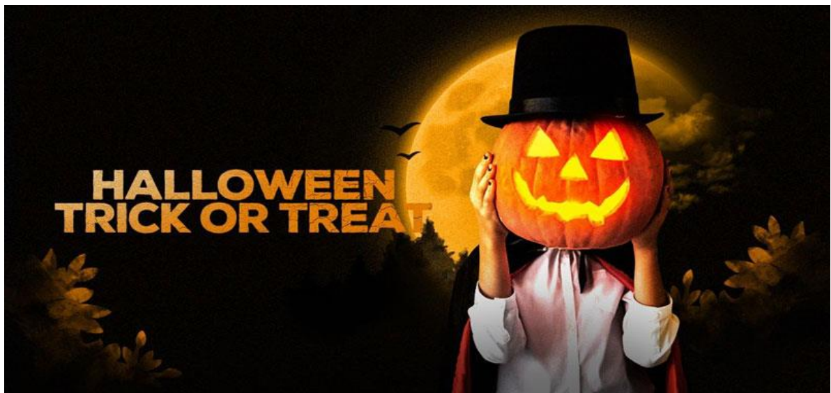
Trò chơi đớp táo

Ngoài trò chơi "Trick Or Treat" khi đi xin kẹo thì trong lễ hội Halloween còn diễn ra nhiều hoạt động khác, một trong số đó chính là trò "Đớp táo". Trò chơi này thường được chơi trong nhà hoặc ngoài trời với các dụng cụ đựng đầy nước với các quả táo được thả trong đó. Người tham