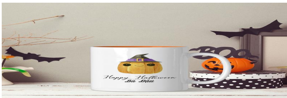
Quà tặng lưu niệm cho người thân dịp Halloween

Trong dịp Halloween, ngoài việc tham gia các hoạt động vui chơi và giải trí, tặng quà cho người thân và bạn bè cũng là một việc không thể thiếu.