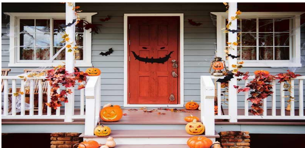
Trang trí nhà cửa dịp Halloween

Trang trí nhà cửa là một trong những hoạt động quan trọng phổ biến nhất trong lễ hội Halloween . Mọi người sẽ tìm những ý tưởng độc lạ để biến căn nhà của họ thành một không gian kỳ quái, ấn tượng.