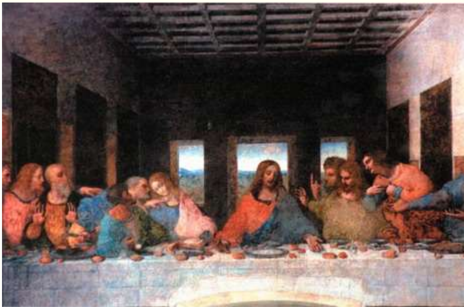
Bữa tối cuối cùng của Chúa Jésus với các tông đồ

Sau đó các lễ này kết hợp với sự di dân của người Do Thái (exode), tiếng Hy Lạp là ἔξοδος = ra ngoài. Vào thời Pharaon, một phần những người Do Thái bị làm nô lệ ở Ai Cập. " ἔξοδος " tượng trưng cho sự ra khỏi Ai Cập, sự giải phóng dân tộc Do Thái. Trong kinh Torah, Thượng Đế báo rằng đại nạn thứ 10 sắp giáng lên đầu người Ai Cập: máu quanh các cửa là dấu hiệu sẽ cho phép Thượng Đế nhận diện được người Do Thái để tha cho họ: " Máu sẽ dùng làm dấu hiệu, trên các nhà mà các người sẽ ở. Ta sẽ thấy dấu máu. Ta sẽ bỏ qua cho các người, và ta sẽ không đánh các người nữa, ta chỉ đánh trên nước Ai Cập. Ngày đó sẽ là ngày để tưởng niệm " (Exode XII, 13). Người đừng ăn bánh mì có men trong bảy ngày, người sẽ ăn bánh mì không men, bánh mì của người nghèo khó, bởi vì các người sẽ vội vã lên đường ra khỏi Ai Cập. Các người sẽ nhớ tới ngày mà các người ra khỏi Ai Cập. (Deutéronome XVI)