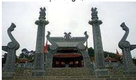
Đền thờ Lạc Long Quân tại đồi Sim (Phú Thọ)

Hùng Vương, Link: http://vi.wikipedia.org/wiki/L%E1%BA%A1c_Long_Qu%C3%A2n