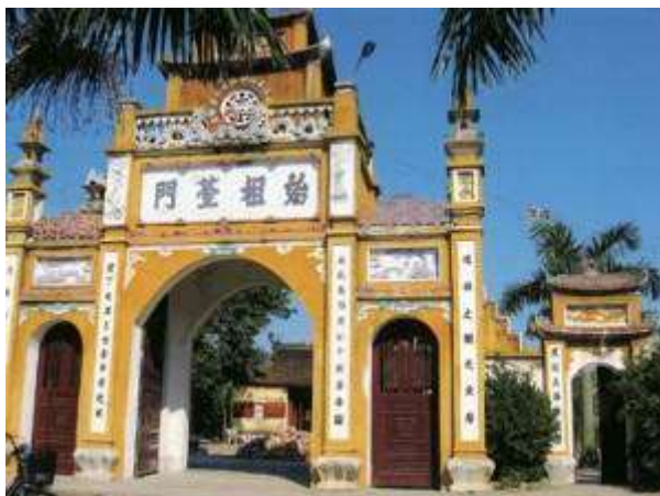
Lăng mộ Kinh Dương Vương

Trong Lịch Triều Hiến Chương Loại Chí của sử gia Phan Huy Chú cũng đã nói tới việc vua Kinh Dương Vương dời đô ra Nghĩa Lĩnh Bạch Hạc Phú Thọ.