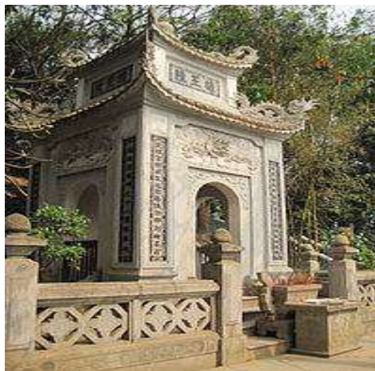
Lăng Hùng vương trên đỉnh núi Nghĩa Lĩnh

Âm lịch hằng năm làm Quốc Tổ trước ngày giỗ vua Hùng Vương thứ 18 1 ngày. Theo cách tính của âm lịch của dân tộc thì tháng 3 là tháng Thìn, còn ngày CỎ 12 ĐỊA CHI : TÍ, SỬU.... HỢI. Ngày mười là ngày Dậu. Dậu là gà thuộc loại chim, mà chim điều là biểu tượng của Tiên, do đó ngày 10 tháng 3 là ngày Tiên tháng Rồng. Để giúp con cháu dễ dàng nhận thức về nguồn gốc dân tộc của mình là CON RỒNG CHÁU TIÊN.