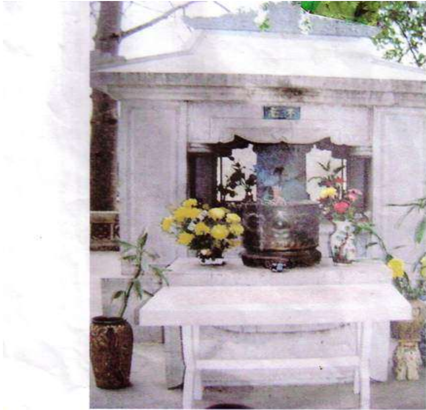
Ảnh mộ Hoàng Đế Kinh Dương Vương, sau khi được nâng cấp bằng Ròng Đá Mộ Kinh Dương Vương nâng cấp bằng Ròng đá do HỘI ĐIỆN CHẤN và các thân hữu thực hiện 29/12/2007