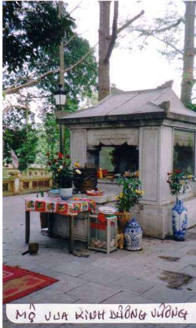
Mộ Kinh Dương Vương trước khi trùng tu 7/12/2007 Làng A Lữ Thuận Thành, Bắc Ninh

Vua Lạc Long Quân lấy con gái vua Đế Lai tên là Âu Cơ, phong Âu Cơ làm Hoàng Hậu . Vua Lạc Long Quân sanh năm Bính Thìn 2825 TTL lên ngôi năm 33 tuổi ( Từ Mậu Tý 2793 đến Bính Thìn 2525 TTL). Mộ Lăng Kinh Dương Vương và đền thờ KINH DƯƠNG VƯƠNG- LAC LONG QUÂN- ÂU CƠ hiện nay vẫn còn tại làng Á Lữ, Huyện Thuận Thành Tỉnh Bắc Ninh, cùng với lăng Mộ vua Hùng và đền thờ 18 chi phái vua Hùng tại Phú Thọ, là nơi tụ hội tâm linh của dân tộc. Chỉ có dân tộc Việt Nam có mà thôi. Các dân tộc khác, quốc gia khác nằm mơ cũng không có.