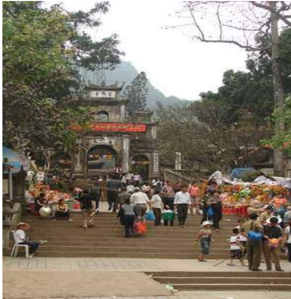
Đền Kinh Dương Vương

Link: http://vi.wikipedia.org/wiki/Ch%C3%B9a_H%C6%B0%C6%A1ng_T%C3%ADch