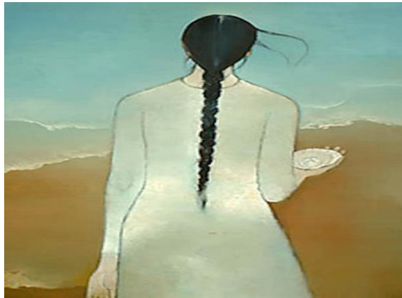
Đời gầy hao quá em xanh quá. (Tranh: Nguyễn Trung)