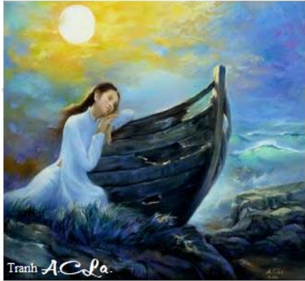
Tranh AC La.

U hoài thương nhớ Mẹ già Nằm yên chẳng thiết lối kia, đường này Không còn tui phận người ngay Bị phường gian hiểm dọa dầy gian nan.