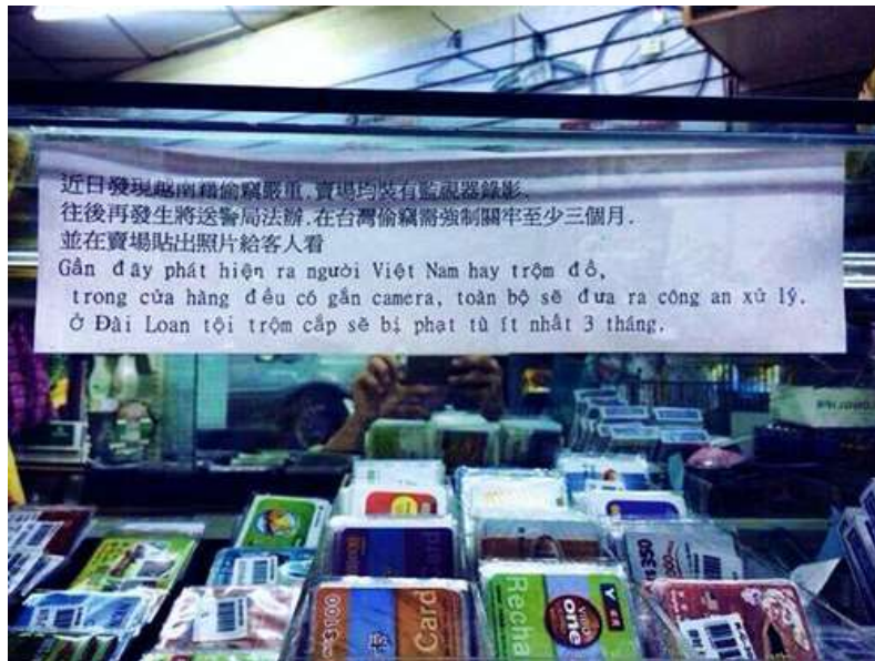
Cảnh báo ăn cắp của người Việt ở Đài Loan

Không chỉ ở Nhật Bản, mà các nước và vùng lãnh thổ khác như Thái Lan, Đài Loan cũng đều có biển cảnh báo về thói trộm cắp vặt của người Việt.