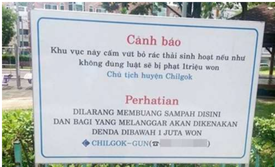
Bên dưới tấm biển ghi danh tính người đứng đầu quận Chilgok (tỉnh Gyeongsang, Hàn Quốc) cùng số điện thoại liên lạc.

Cư dân mạng cũng lan truyền, bàn tán bức hình chụp tấm biển cấm vứt rác bừa bãi bằng tiếng Việt tại Hàn Quốc. Nội dung ghi trên tấm biển: ‘Khu vực này cấm vứt bỏ rác thải sinh hoạt, nếu như không đúng luật sẽ bị phạt 1 triệu won (khoảng 19 triệu đồng)’.