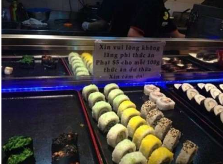
Bức ảnh tại một nhà hàng ở Singapore là minh chứng đáng buồn cho thói quen ăn uống thiếu văn minh của người Việt.

Cư dân mạng cũng lan truyền, bàn tán bức hình chụp tấm biển cấm vứt rác bừa bãi bằng tiếng Việt tại Hàn Quốc. Nội dung ghi trên tấm biển: ‘Khu vực này cấm vứt bỏ rác thải sinh hoạt, nếu như không đúng luật sẽ bị phạt 1 triệu won (khoảng 19 triệu đồng)’.