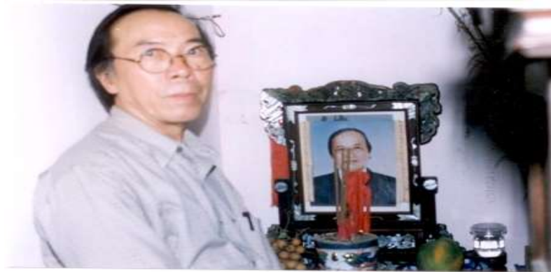
Bên bàn thờ Định Giang, Mỹ Dạ – Huế 2001