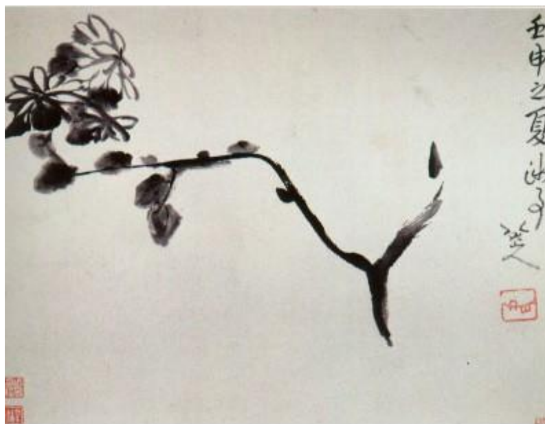
Cúc - tranh của Bát Đại Sơn Nhân đời Minh-Thanh

Họa sĩ Hoàng Công Vọng sống trong rừng núi. Ông vẽ bức danh họa «Nhà lan» khi ở trong Huyền Chân đạo trường, mà Huyền Chân đạo trường chính là trạng thái tự nhiên, vô niệm. [5] Họa sĩ Thạch Đào chủ trương: