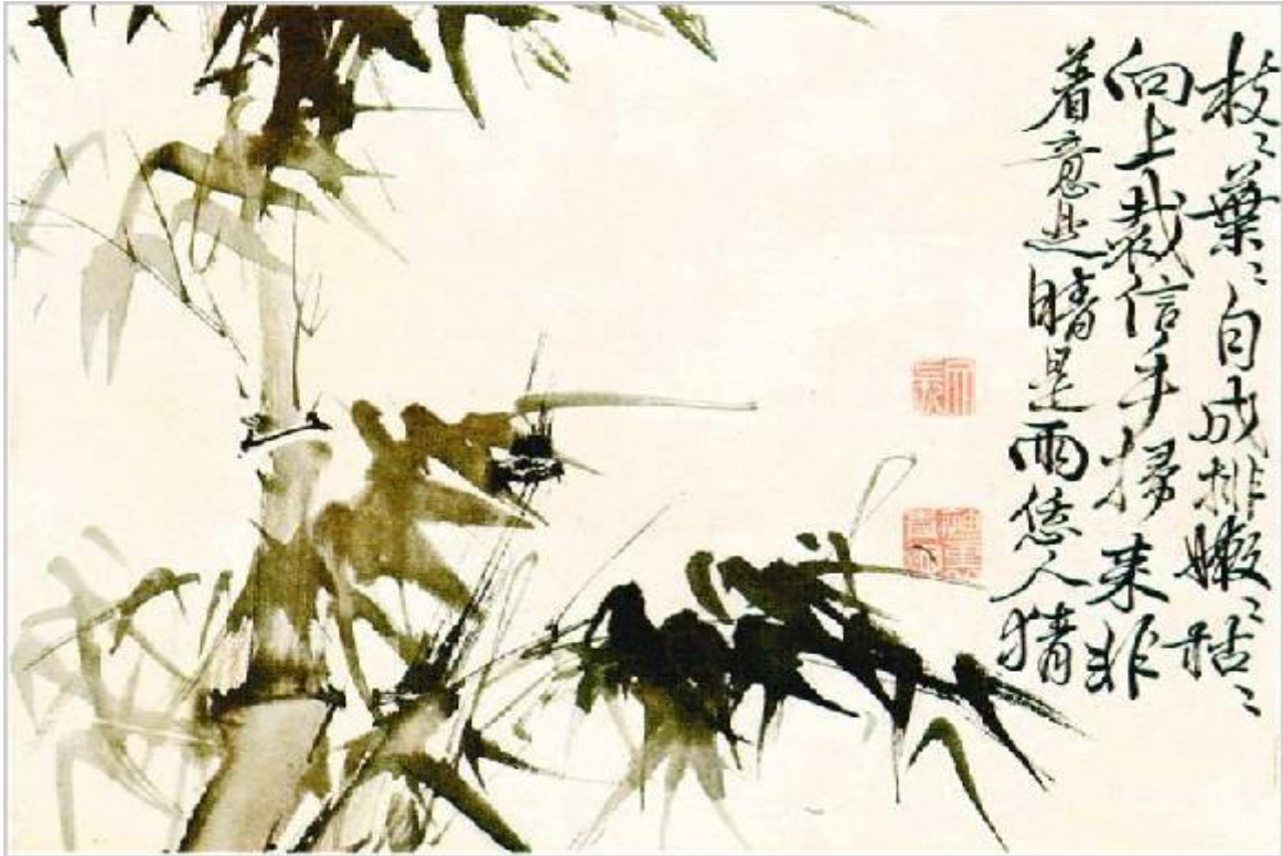
Trúc - tranh của Từ Vị đời Minh