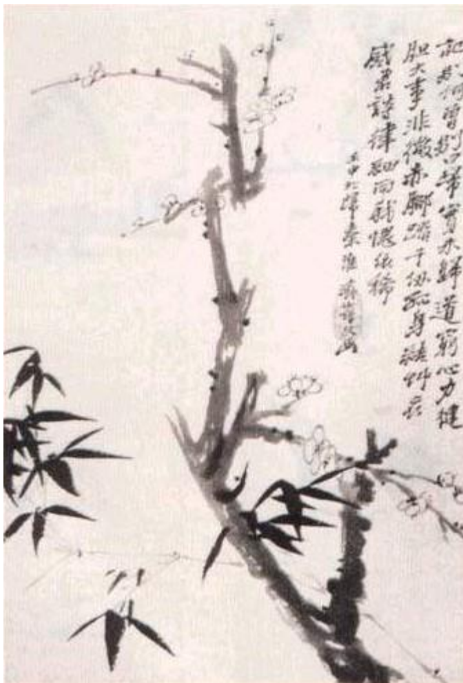
Trúc mai - tranh của Thạch Đào đời Thanh

«Ta ưa tĩnh lánh nơi thành phố, Xa phồn hoa dựng cổ nhà tranh. Một vùng non núi bao quanh, Lang thang đây đó, thênh thênh tác lòng Mùa xuân tới ngắm trông chim lượn Mùa hè sang, suối xuống tắm chơi. Mùa thu, đỉnh thẳm leo coi. Mùa đông sương nắng, nằm vùi ngoài không. Bốn mùa trời thông dong hưởng thú, Nhật nguyệt kia xin cứ vùn xoay. Rảnh thời kinh kệ ta coi Mệt rồi ta ngủ, ngủ vùi ổ rơm. Bạn hỏi ta mơ màng ai đó? Ta liền thưa: Gặp gỡ Hiên Viên. Hiên Viên đem bí quyết truyền. Cấm ta chẳng được nói lên với đời. Ao ta đây tuổi trời vài chục, Sở truyền ta rộng mức biển khơi. Khi ta múa bút vẽ vờ, Mới hay công dụng tuyệt vời bao la. Bí quyết ấy nếu ta chỉ giáo, Thời núi non khuynh đảo nát tan...» [8]