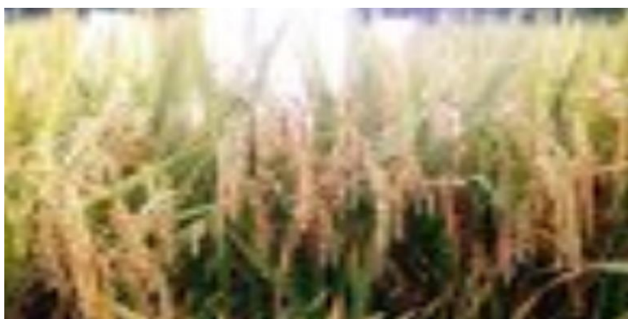
Lúa Thần nông