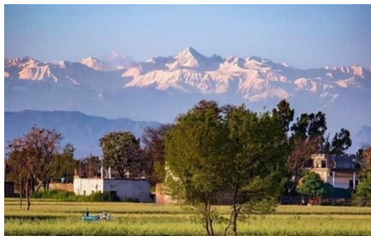
Ngọn núi Himalaya ở Ấn Độ không bị mây mù che phủ