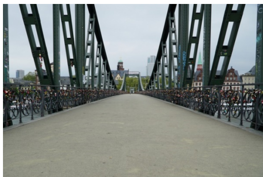
Cây cầu sắt (Der einserne Steg) nổi tiếng ở Frankfurt, bình thường rất đông du khách qua lại, thời Covid-19 không có một bóng người

Về mặt xã hội, theo thống kê của chính phủ Đức, nạn trộm cắp giảm đi thấy rõ. Ăn trộm cũng sợ trèo làm vào nhà đang là ổ dịch Covid-19, không biết có lấy được gì không nhưng vợ vài con virus mang về khổ vào thân. Còn dân móc túi, thì càng thê thảm hơn, luật cách xa đến 2 m, đâm ra khó sát lại gần, mà không lại gần thì làm sao móc túi. Thành ra xã hội hôm nay như thời Nghiêu Thuấn mà người Trung Hoa thường ca tụng, nhà không cần đóng cửa và đồ đạc để ở ngoài đường không ai dám lượm vì sợ dính virus. Cũng vì sợ lây nhiễm, con người để ý đến sức khỏe nhiều hơn, ra đường về nhà rửa tay kỹ hơn. Vì cách ly, nhà hàng đóng cửa, nên muốn ăn phải lăn vô bếp, đâm ra ăn uống cũng cẩn thận hơn, nhiều rau bớt thịt nhất là thịt từ các động vật hoang dã. Về giao thông, tai nạn cũng giảm hẳn, không đi đâu thì làm gì có đụng xe, không ra đường làm sao bị xe cán. Tôi chưa bao giờ được tận hưởng cái trống vắng trên đường phố, một mình một cõi thênh thang trên một đoạn đường dài.