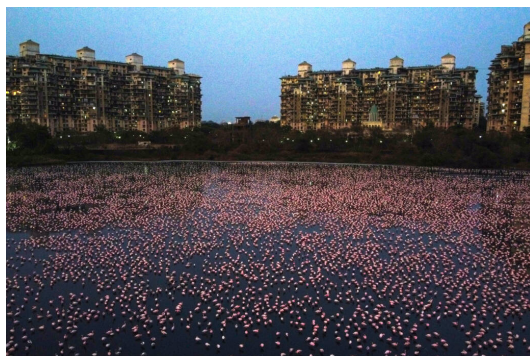
Cả ngàn con chim Hồng Hạc trên sông ở thành phố Mumbai