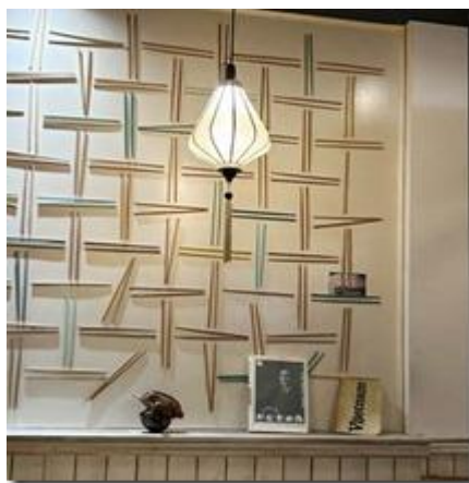
'Tranh' đũa.