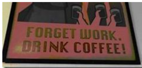
Forget Work. Drink Coffee!

Có một bức tranh trái khoáy, tréo cẳng ngỗng là khuyến khích uống cà phê bỏ làm việc. Một cán bộ giờ cao ly cà phê, cao hơn cả lá cờ, hô to thúc giục: 'Quên Làm Việc Đi, Hãy Uống Cà Phê!':