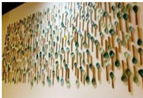
'Tranh' Thìa (ảnh của tác giả).

Về tranh ảnh dĩ nhiên có những tranh dân gian loại tranh Đông Hồ như tranh chăn trâu, mục đồng đội lá sen ngồi thổi sáo trên lưng trâu, tranh Rồng Rắn Lên Mây.