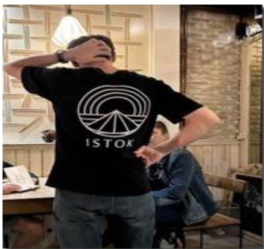
Tiệm ăn Việt Nam Istok (Ăn).

Từ xa đã nhận thấy ngay tiệm Ăn Istok này nhờ mấy chiếc đèn lồng Hội An treo bên ngoài tiệm.