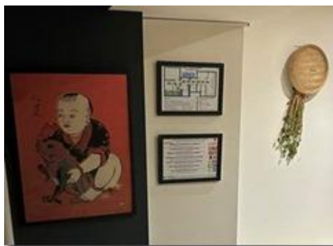
Em bé ôm con cóc.

Đây là tiệm phở theo đầu óc ‘thực tiễn’ đáng lẽ nên treo tranh em bé ôm gà thích hợp với phở gà hơn. Có lẽ vì tiệm không bán phở gà nên không treo tranh gà. Có thể ông chủ thích cóc hơn vì thích làm thơ.