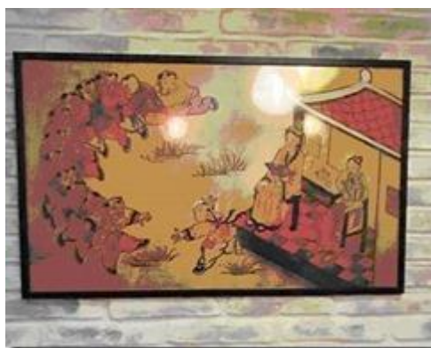
Tranh Rồng Rắn Lên Mây.

Về tranh ảnh dĩ nhiên có những tranh dân gian loại tranh Đông Hồ như tranh chăn trâu, mục đồng đội lá sen ngồi thổi sáo trên lưng trâu, tranh Rồng Rắn Lên Mây.