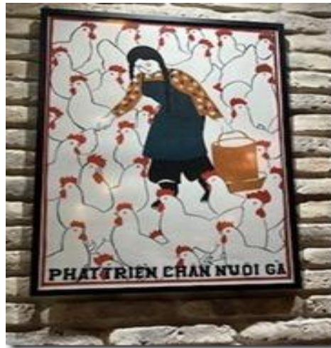
Phát triển chăn nuôi gà.

Có một bức tranh trái khoáy, tréo cẳng ngỗng là khuyến khích uống cà phê bỏ làm việc. Một cán bộ giờ cao ly cà phê, cao hơn cả lá cờ, hô to thúc giục: 'Quên Làm Việc Đi, Hãy Uống Cà Phê!':