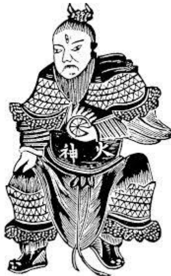
Toại Nhân: Thần Hỏa ( 神 火 )

Phục Hy là Thanh Tinh là Rồng Xanh thuộc chủng Việt