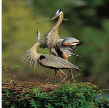
Hình Ngọc Long Toại ( Cặp Trống / Mái )

Trước hết nên hiểu nền Văn Hóa Việt Nam xưa là Việt Nho, Việt Nho khác với Hán Nho của Tàu, sự khác biệt nền tảng là ở nơi Dịch lý Âm Dương Hoà , nền tảng Dịch lý Việt là cặp đối cực Trống / Mái ( Ngọc Long Toại ) và cặp đối cực Tiên / Rồng.