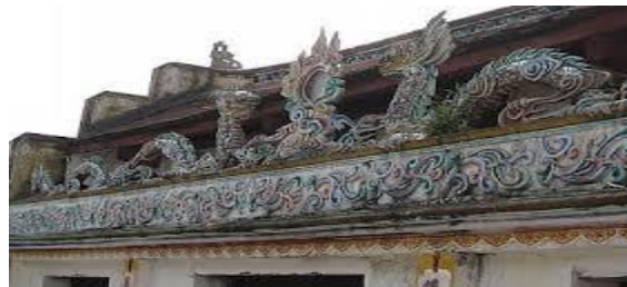
Hình Lưỡng Long Triều Nguyệt trên mái nhà

Và cũng là Lưỡng Long ( 2 Dương ) triều Nguyệt ( 1 Âm ) : Tượng trưng cho Quẻ Ly