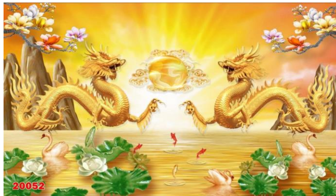
Lưỡng Long Triều Nguyệt