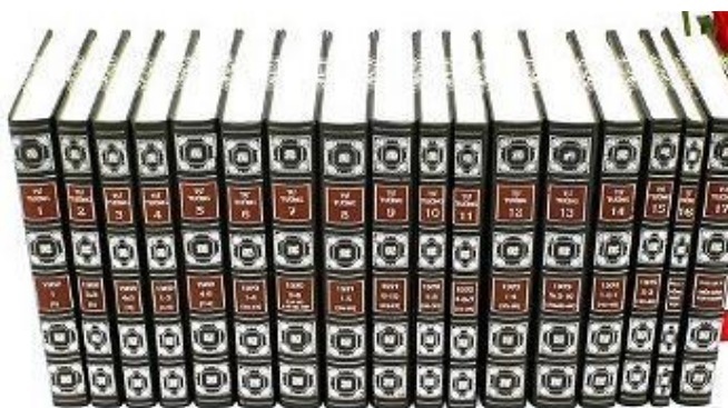
Tạp chí Tư Tưởng (ấn bản in mới)

Tạp chí sau khi được số hóa với độ phân giải cao, file sẽ được đưa vào xử lý trên máy tính, tẩy trắng nền, làm rõ chữ, đồ chữ mất nét nhưng tuyệt đối không tác động vào văn bản, không can thiệp vào chính tả, quy cách hay nội dung. Sau khi hoàn thiện được đưa in ấn trên loại giấy và mực tốt. Chúng tôi gọi việc làm này là ảnh ấn. Toàn bộ lợi nhuận thu được từ việc phát hành ấn phẩm này phục vụ cho các hoạt động cộng đồng của Thư viện Huệ Quang.