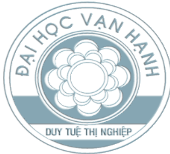
Logo Viện Đại Học Vạn Hạnh