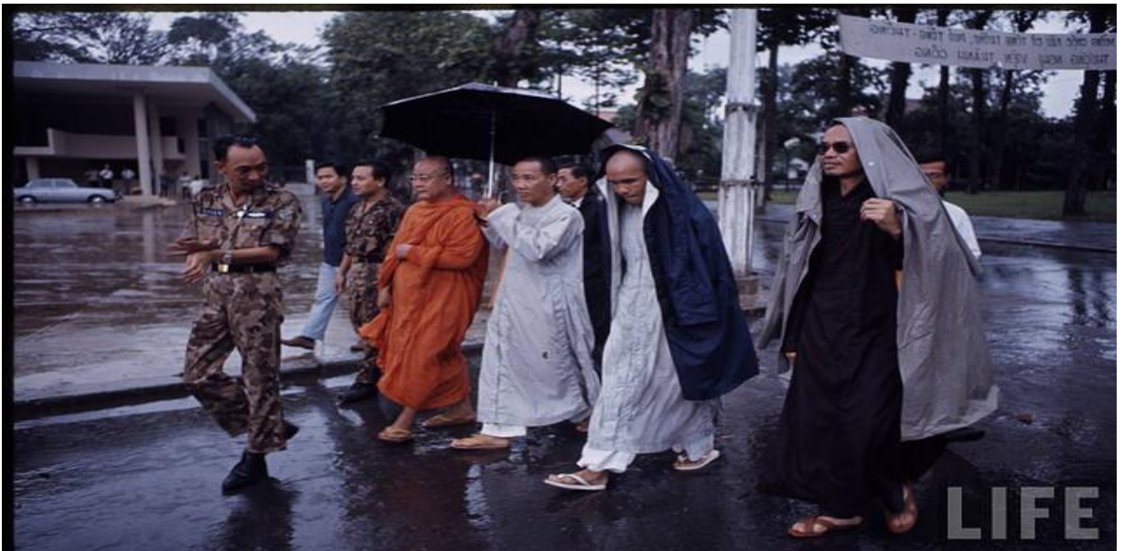
Tướng Nguyễn Ngọc Loan, Tổng Giám Đốc Cảnh Sát Quốc Gia trong quân phục Cảnh Sát Dã Chiến đang cùng các nhà sư cầm đầu biểu tình đi về phía cổng Dinh Độc Lập