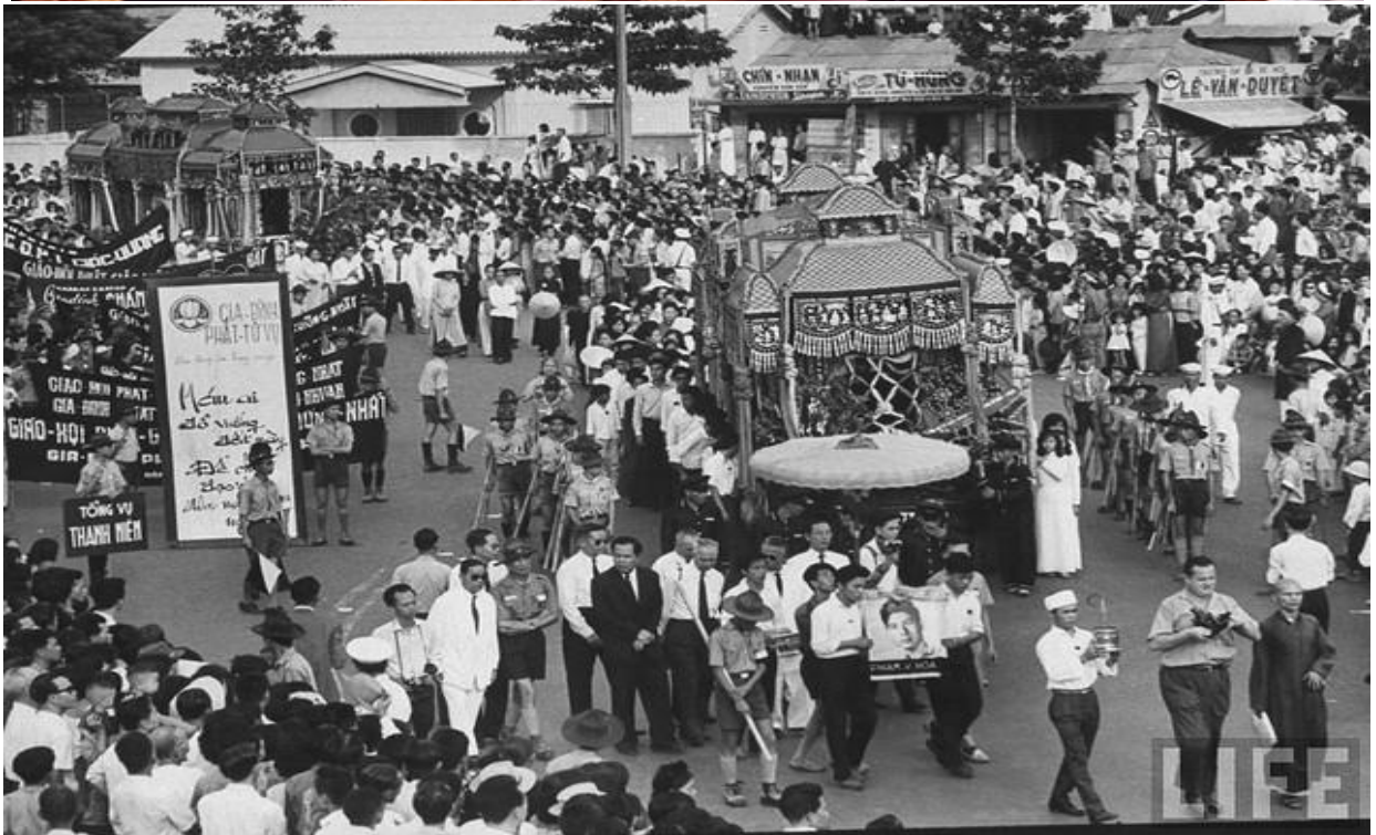
9-1964 During a Buddhist funeral for 2 young Buddhist killed in Buddhist -Catholic rioting.