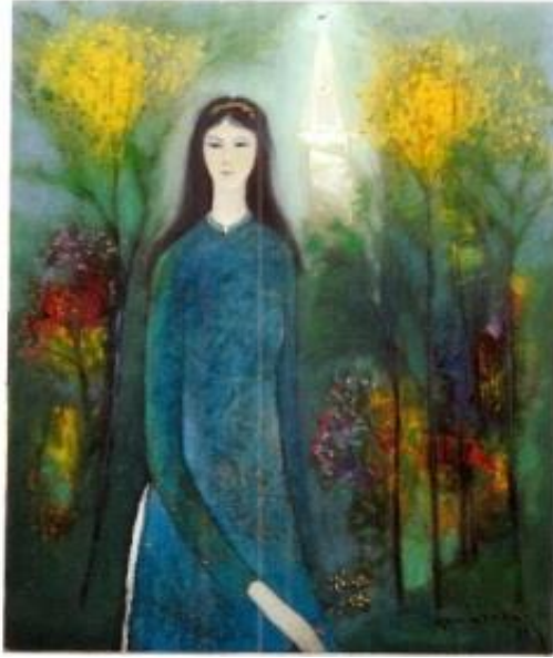
Thiếu nữ và hoa mimosa-dinhcuong

Bây giờ buồn khác xưa không? Thơ em nói tháng giêng nào hoa rụng Melbourne chiều cây khua lá Hát sầu mấy điệu Vĩnhlong