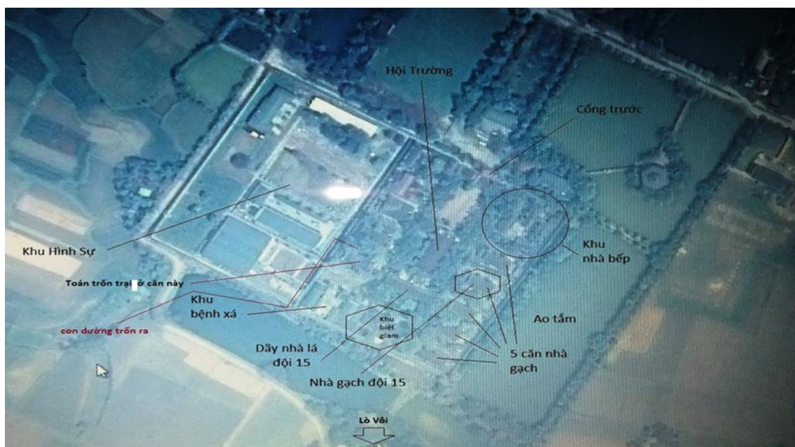
Toàn cảnh trại 6 Nghệ Tĩnh đầy đủ chi tiết

Đang là đội trưởng đội 15 đđlv. và một số các anh Xã Trưởng miền Tây như: Sáu, Đăng, Hòa, Tín cộng thêm một số các anh mà tôi không nhớ tên.