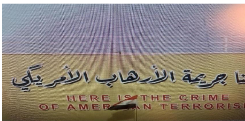
VÀ GIÒNG CHỮ CHỐNG MỸ KẼ TƯỞNG ĐÀI, NGAY TRONG LÒNG THỦ ĐÔ BAGDAD.

Đến giờ tôi vẫn không thể tin những gì đang diễn ra trước mắt mình. Đám dân chen chúc, hỗn loạn, dẫm đạp lên nhau giành lấy một chỗ trên máy bay. Người Mỹ không bao giờ có thể nghĩ một chuyện vô lý như