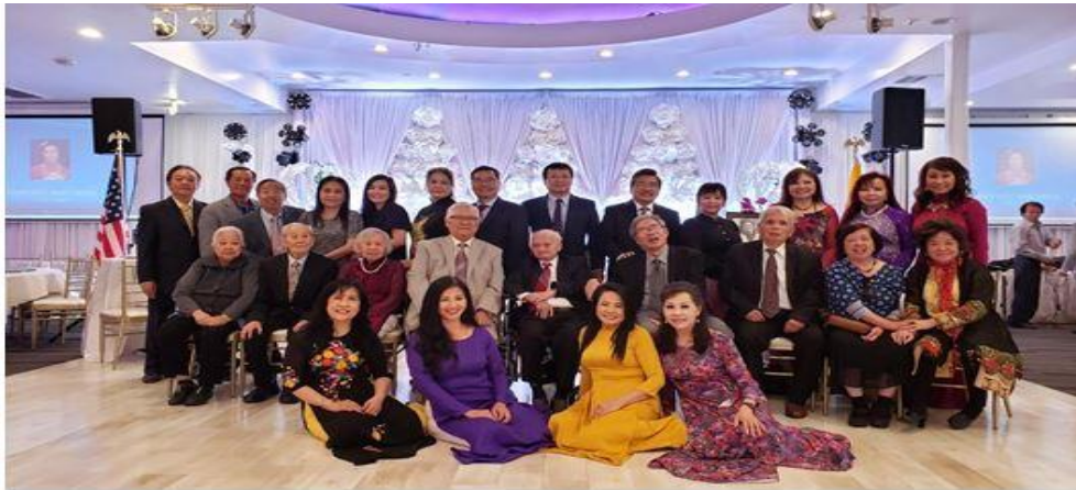
Ảnh chụp kỷ niệm nhân Giỗ 4 năm của nhà văn Minh Đức Hoài Trinh, 13/06/2021.

Phải chăng Minh Đức Hoài Trinh đã ra đi, nhưng sự ngưỡng mộ và luyến tiếc vẫn ở mãi với nhiều người.