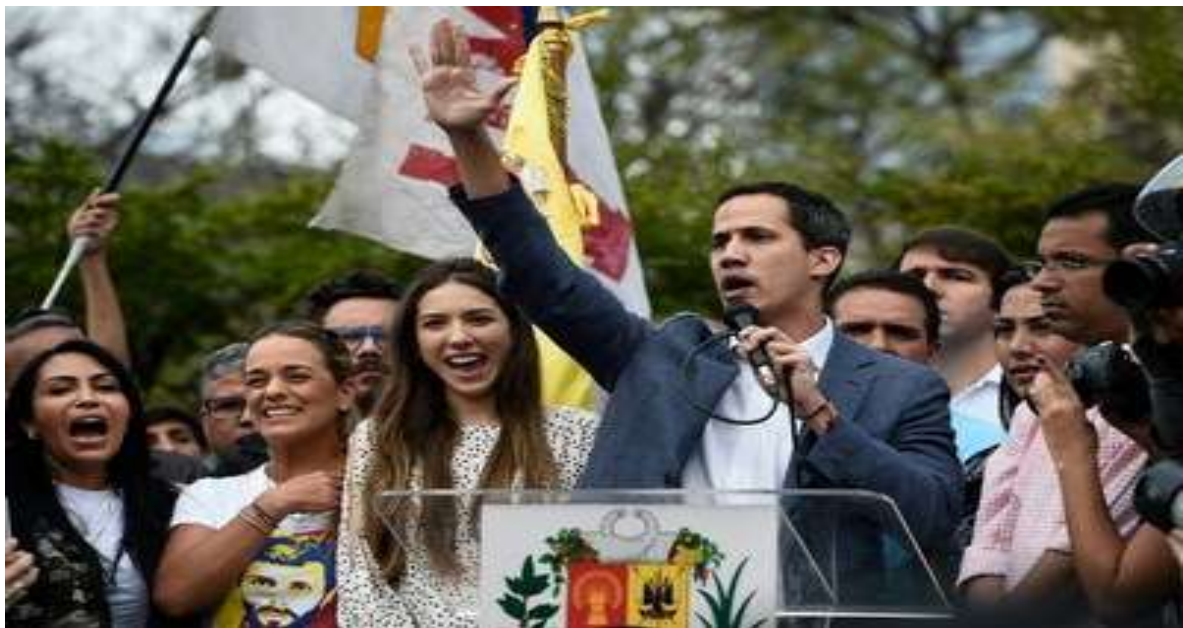
Chủ tịch Quốc hội Venezuela, người vừa tuyên bố là Tổng thống tạm quyền của nước này, Juan Guaido (phải) đang phát biểu đứng cạnh vợ là Fabiana Rosales (giữa) tại Caracas hôm 26/1/2019

Venezuela là bài học điển hình cho thấy, một đất nước dù giàu tiềm năng đến đâu và điểm xuất phát tốt đến mấy, (Venezuela từng có GDP đầu người sau Chiến tranh thế giới II cao thứ 4 thế giới) nhưng nếu đi sai đường, chọn nhầm ý thức hệ và mô hình phát triển, thì trước sau cũng sẽ phải trả giá cực đắt. Giờ đây dân Venezuela phải bới các thùng rác để kiếm thức ăn và đến cả giấy vệ sinh cũng chẳng có mà dùng.