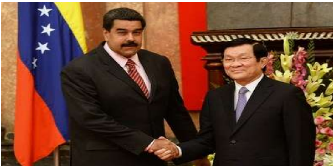
Hình minh họa. Tổng thống Venezuela Nicolas Maduro (trái) bắt tay Chủ tịch Trương Tấn Sang (phải) ở Phủ Chủ tịch ở Hà Nội hôm 31/8/2015

đạo Trung Quốc đã vứt “chủ nghĩa” vào sọt rác. Đối với Đặng Tiểu Bình, “mèo trắng hay mèo đen không quan trọng”, quan trọng là nó phải bắt được chuột. Trong khi các lãnh đạo Việt Nam thì ngược lại, bắt được chuột hay không bắt được chuột, chẳng sao, quan trọng là nuôi mèo màu gì, “trắng” hay “đen”?