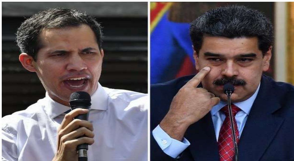
Hình ghép hôm 25/1/2019: Chủ tịch Quốc hội Venezuela Juan Guaido (trái) phát biểu trước những người ủng hộ tại Caracas hôm 21/1/2019, Tổng thống Nicolas Maduro đề nghị họp báo ở Caracas hôm 25/1/2019

Một thời ở thế kỷ trước, nhiều thế hệ học sinh Việt Nam hầu hết đều thuộc lòng mấy câu thơ: “Du kích quân Caracas đã vì anh / Bất một tên giặc Mỹ giữa đô thành...”[1]. Còn giờ này, nếu lính của Nicolas Maduro đụng đến “chân lông” nhà ngoại giao nào của Hoa Kỳ, thì dù có “đội mồ” ngồi dậy, Tố Hữu cũng chẳng dám làm thơ ngợi ca kiểu “đi mây về gió” như vậy nữa.