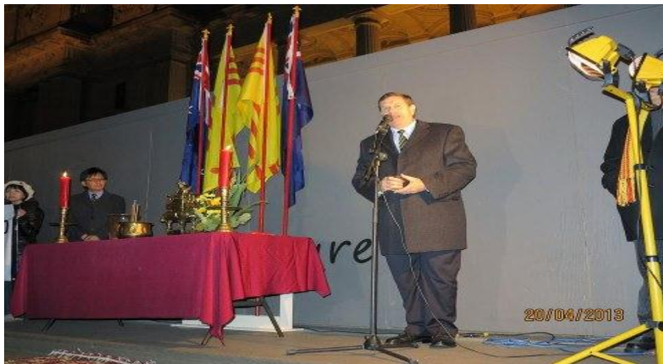
Đại diện chính phủ tiểu bang Dân biểu tự do Murray Thompson