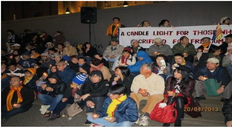
Cùng Cầu Nguyện