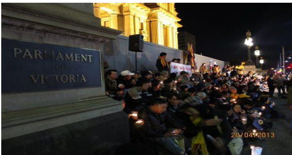
Cùng Cầu Nguyện