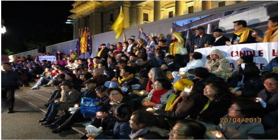
Cùng Cầu Nguyện