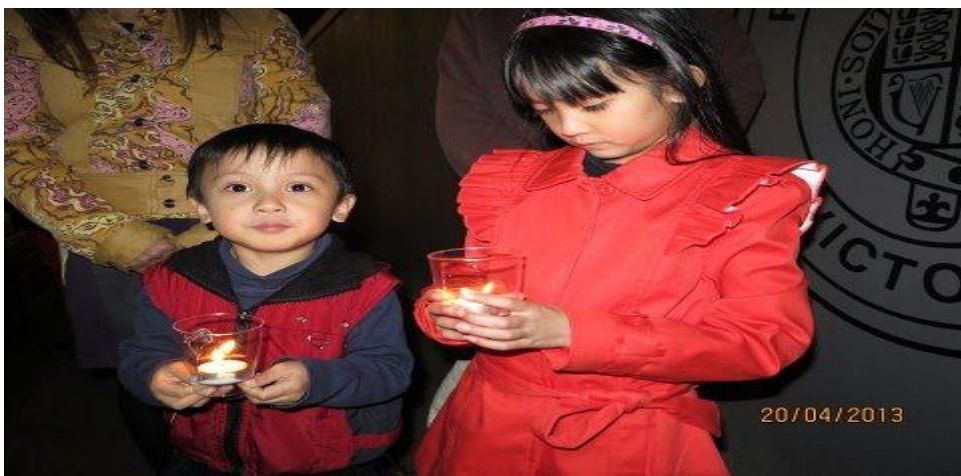
Thế Hệ Tương Lai