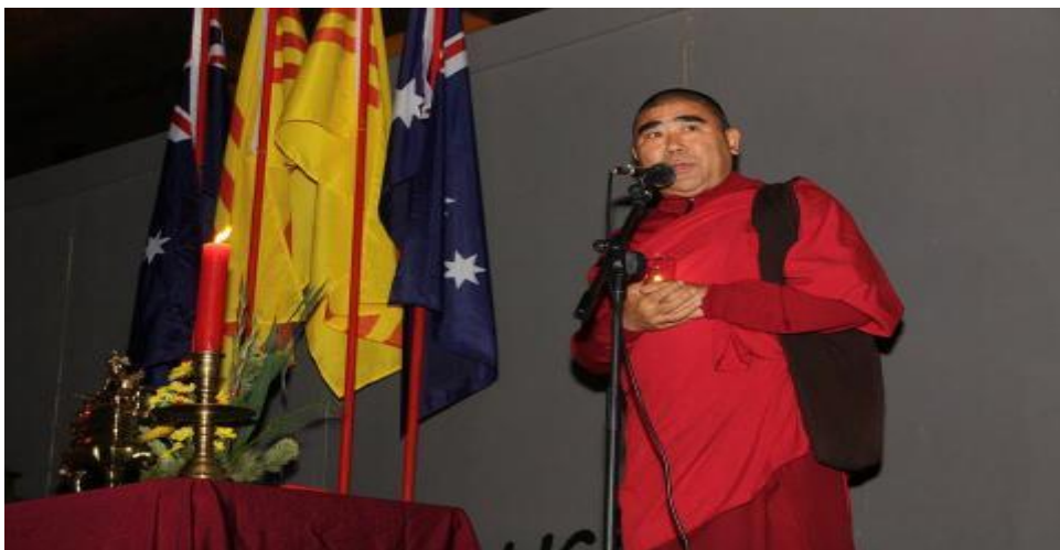
Hòa Thượng Tây Tạng Thupten Khedup