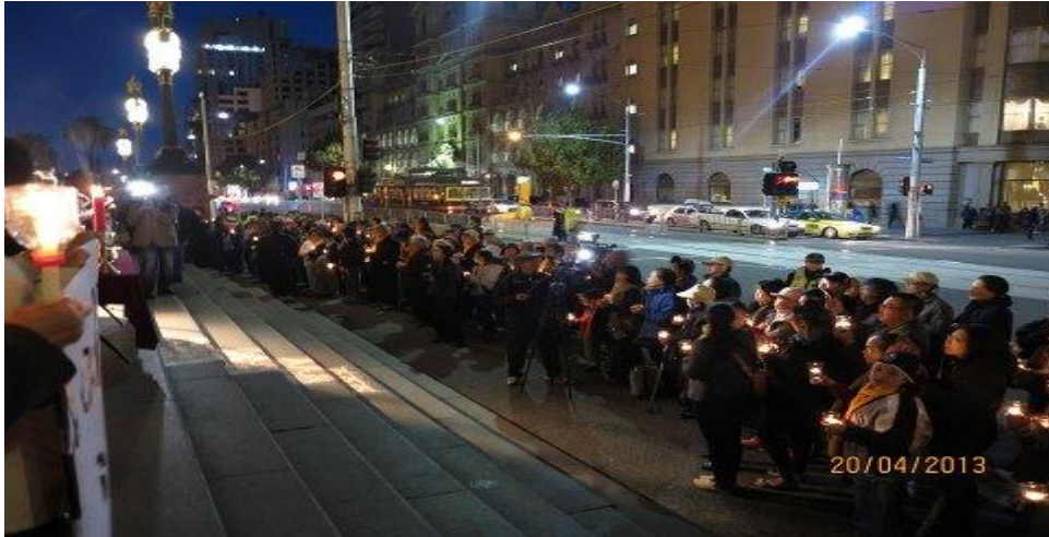
Đồng Cầu Nguyện